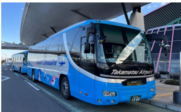
【ことでんバスが運行する高松空港リムジンバス】