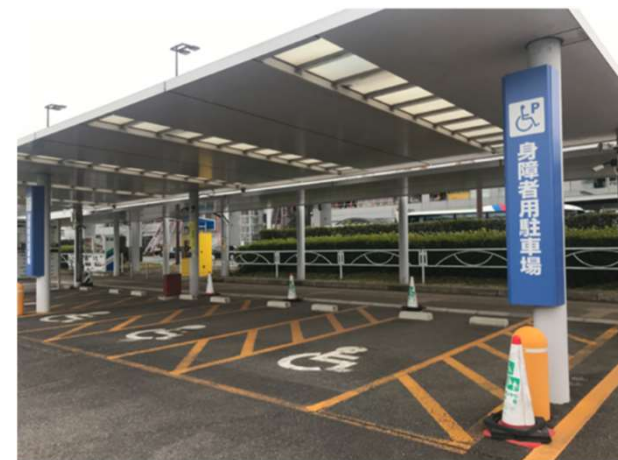
平面駐車場エリア 14台

※受付時間外は、出庫時に、出口ゲートまたは事前精算機横のオートフォンでお申し出ください。